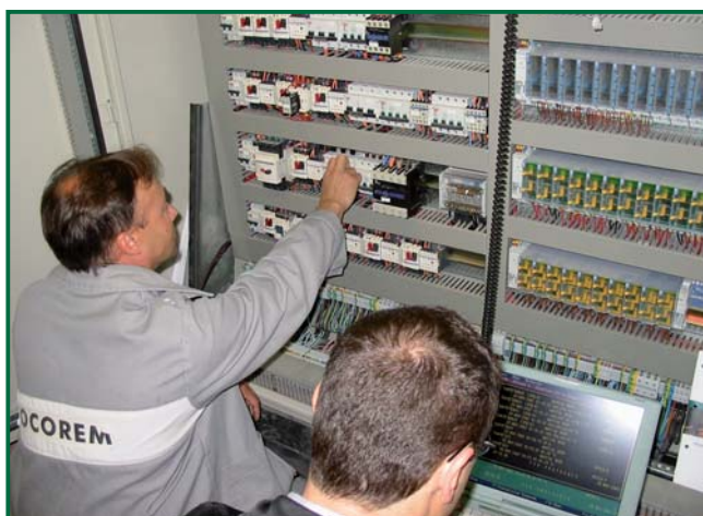
Un chantier à Purpan.