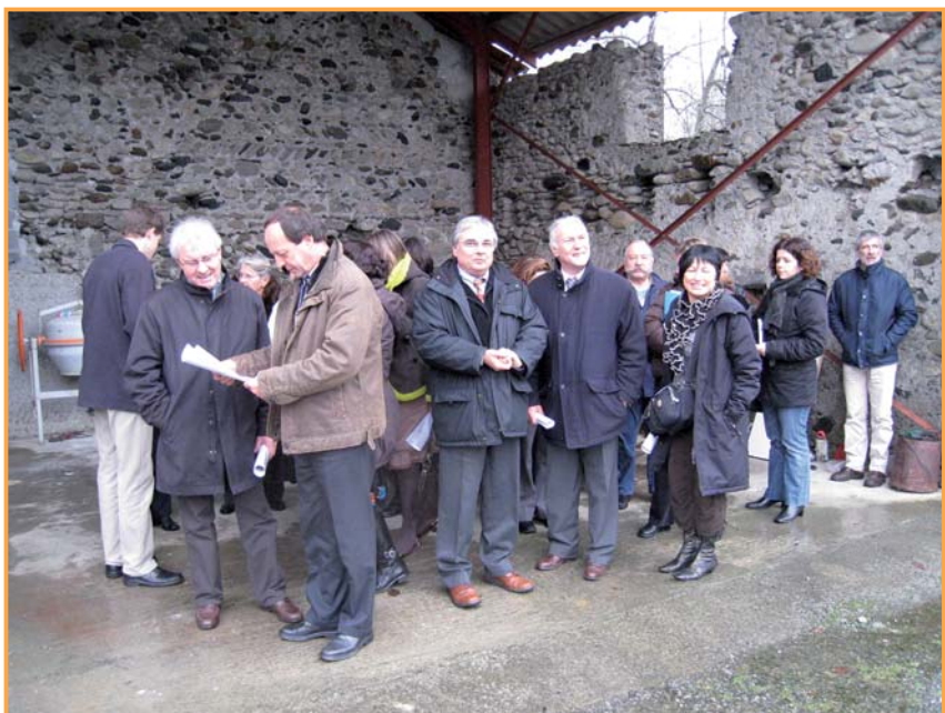
Visite de logements financés par l'ANAH et le Conseil Général des Hautes-Pyrénées sur l'Opération Programmée d'Amélioration de l'Habitat Nestes Barousse.

Aujourd'hui, 10 ans après sa création, nous avons constitué une