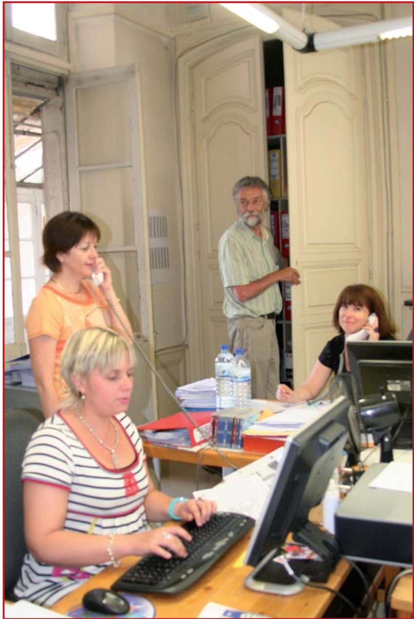
Une partie de l'équipe du Groupe Coopératif d'architecte et d'urbanisme.

Aujourd'hui, nous travaillons essentiellement sur Midi-Pyrénées, Aquitaine et Languedoc-Roussillon. 80 % de nos dossiers concerne des