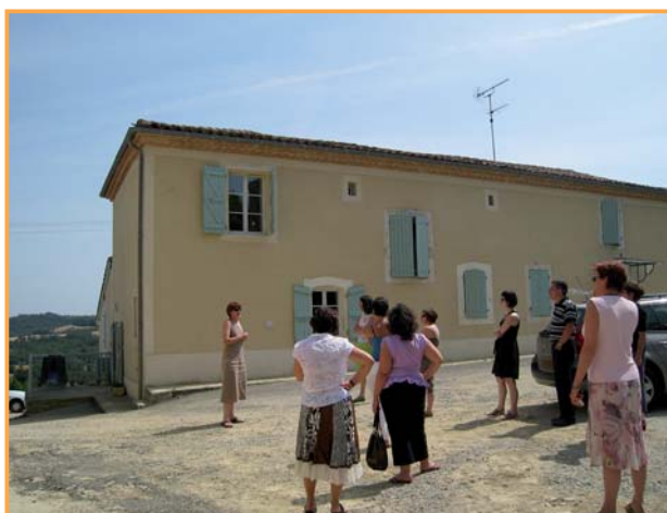
Altaïr présentait aux membres du comité de pilotage, la réalisation d'une opération à côté d'Auch (5 locatifs très sociaux) financée par l'Etat, l'ANAH et le Conseil Général du Gers.

Nous nous revendiquons entreprise du "social business", c'est à dire que contrairement aux associations, fondations ou autres organismes à but non lucratif dépendantes de financements extérieurs, nous sommes une entité auto-suffisante financièrement. Mieux ! Nous cherchons à être rentable, dans le but d'atteindre un objectif de mieux-être social et de maximiser notre impact positif sur un système, sur un territoire.