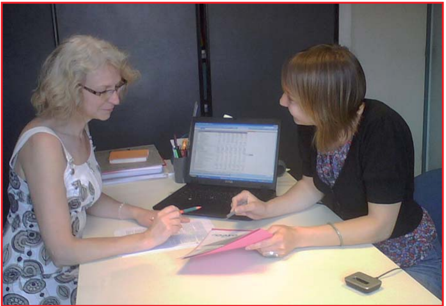
Accueil, écoute, conseils et accompagnement sont les priorités de l'UR SCOP et de son réseau dans les départements.

Dans le cas de reprise d'entreprise en difficulté, l'UR SCOP est attentive à vérifier la présence des 3 composantes indispensables suivantes : l'existence d'une équipe porteuse d'un projet coopératif, au sein de cette équipe, l'existence d'un leader naturel compétent, l'existence d'un projet économique équilibré et d'un projet d'entreprise à moyen terme.