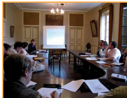
Elus et techniciens du Conseil Général du Gers et des Communautés de Communes de l'est gersois, de l'Isle Jourdain réunis autour du cabinet Altaïr pour étudier le développement de logements sociaux dans le parc privé existant.