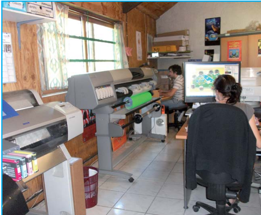
L'atelier PAO de l'imprimerie Images.