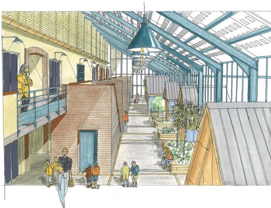
L'école de Bordères-sur-l'Echez

Nous ne regrettons pas d'avoir fait ce choix. La SCOP était le statut le